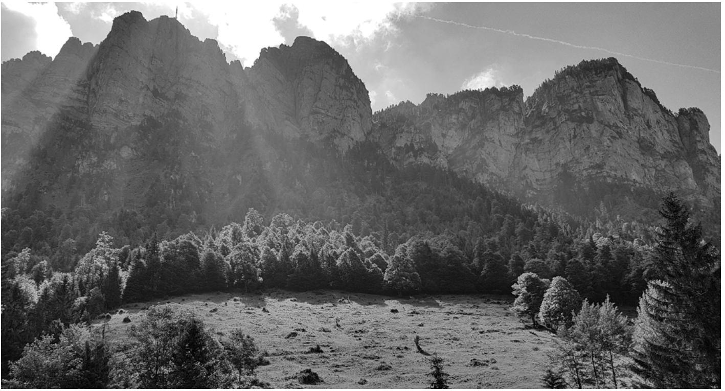
Im Juststal.